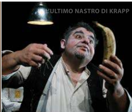
L'ULTIMO NASTRO DI KRAPP